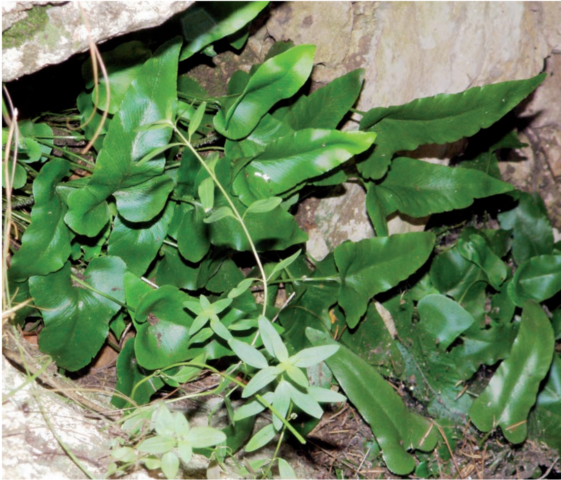
Figura 5. Phyllitis sagittata , a l'entrada de l'avenc de Cantacorbs (11-X-2014).

cat per Montserrat Domingo, ermitana de Sant Joan: aquesta localitat és l'única coneguda per al territori catalanídic central.