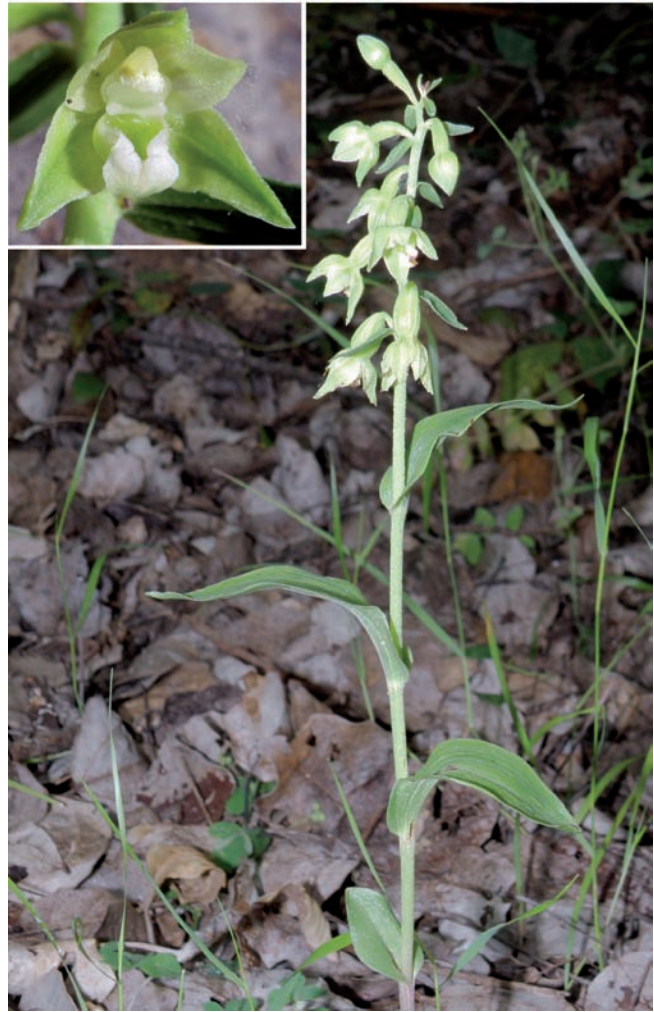
Figura 1. Epipactis fageticola , dins d'una albereda a la vora del riu Montsant (12-VI-2011). El requadre mostra els detalls de la flor.

Tàxon del complex d' E. phyllanthes conegut de diversos indrets del centre i nord de la Península Ibèrica. Tot i que va ser inicialment considerat com a propi de fagedes, sembla que és més comú en boscos riparis (Gamarrà et al. , 2014; Crespo, 2005). A Catalunya, s'ha citat en boscos caducifolis humits de la Garrotxa, el Ripollès, l'Alt Empordà i Osona (Oliver et al. , 2009). A les Terceres Jornades de Prospecció Biològica de Catalunya (2016) s'ha indicat també al la Conca de l'Abella, quadrat DG3667 (Font, 2017). La localitat descrita aquí, per tant, és la primera per al sud de Catalunya. Vessant sud: Riu Montsant, a l'interior d'una vella albereda (184 m), unes desenes d'individus en flor (Fig. 1), 12-VI-2011,