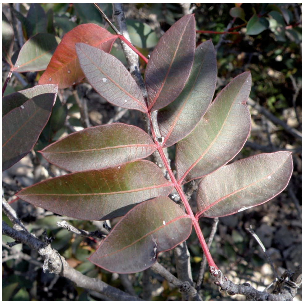
Figura 4. Pistacia × saportae , detall de la fulla marcescent. Base del cingle dels Montalts (12-XII-2012).

tingir-la del pi carrasser autòcton ( P. nigra subsp. salzmannii (Dunal) Franco) en les primeres fases de desenvolupament. Vessant sud: Pla del mas de Forçans (585 m), 11-VII-2010, CF1469; Fondalades i vessants entre el mas de Forçans i el mas Blanc, a prop del camí dels Cartoixans (580-650 m), 11-VII-2010, CF1469. Montsant occidental: Voltants del Mas Déu, cap al coll de la Guixera (610 m), 17-IX-2011, CF1368; Collet del Pla del Bisbe i vessant oriental de la punta de la Canaleta (630-660 m), 17-IX-2011, CF1368.