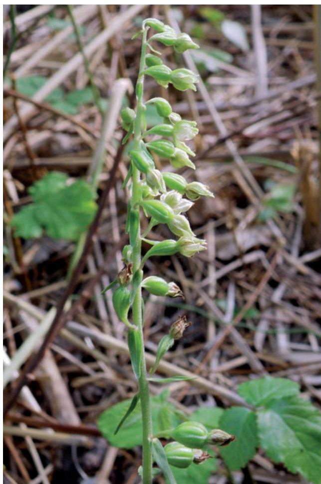
Figura 2. Epipactis rhodanensis , en un codolar al marge d'una albereda, a la vora del riu Montsant (19-VI-2016).

ra localitat per al territori catalanídic central. Probablement una exploració més acurada dels boscos riparis a l'època adequada permetrà trobar noves localitats de les orquídies pertanyents a E. gr. phyllanthes .